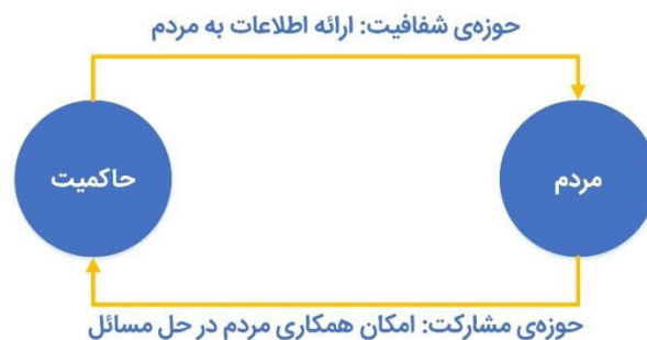
شکل ۱- مدل مفهومی حکومت باز.

مفهوم حکومت باز که به تعبیری نسخه دوم حکومت خوانده می‌شود، به باز بودن درب‌های حکومت به روی مردم اشاره دارد. به این ترتیب که هم مردم بتوانند با باز بودن درب‌ها، اتفاقات درون حکومت را رؤیت کنند و هم در آن مشارکت کنند. در نسخه اول حکومت، مردم تنها نظاره‌گر بوده و مشارکت حداقلی در آن دارند. این گام در حکومت، گام شفافیت است. به این ترتیب شفافیت زیرساخت حکومت باز است. ابتدا درب‌های حکومت باید به روی مردم باز باشد تا آن‌ها اتفاقات درون آن را بتوانند مشاهده کنند و مشکلات و ایرادات را ببینند. نسخه دوم حکومت، مشارکت گسترده مردم را در بر دارد، به این ترتیب که درب‌های حکومت به روی مردم باز است تا آن‌ها بتوانند ایده‌ها، نظرات و راهکارهای خود را به دست حکومت برسانند تا در حل مشکلات جامعه سهیم باشند. بنابراین حکومت باز نه تنها شفافیت را در بر دارد، بلکه مشارکت حداکثری مردم در امور را شامل می‌شود. در شکل ۱ این مفهوم به صورت شماتیک نشان داده شده است.