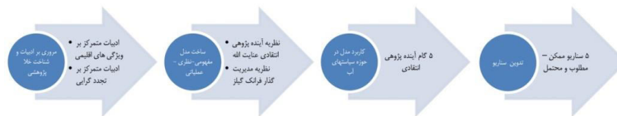
شکل ۱- گردش کار مراحل پژوهش.

لایه‌ای علت‌ها) و گام پنجم نتایج پایانی مقاله (سناریوها)، طی مصاحبه‌های عمیق و نیمه ساختاریافته با صاحب نظران (حوزه آکادمیک، بخش خصوصی و شرکت مهندسی مشاوره و بخش دولتی) اعتبارسنجی شده و پس از تعدیل، نتیجه نهایی مورد تأیید قرار گرفته است.