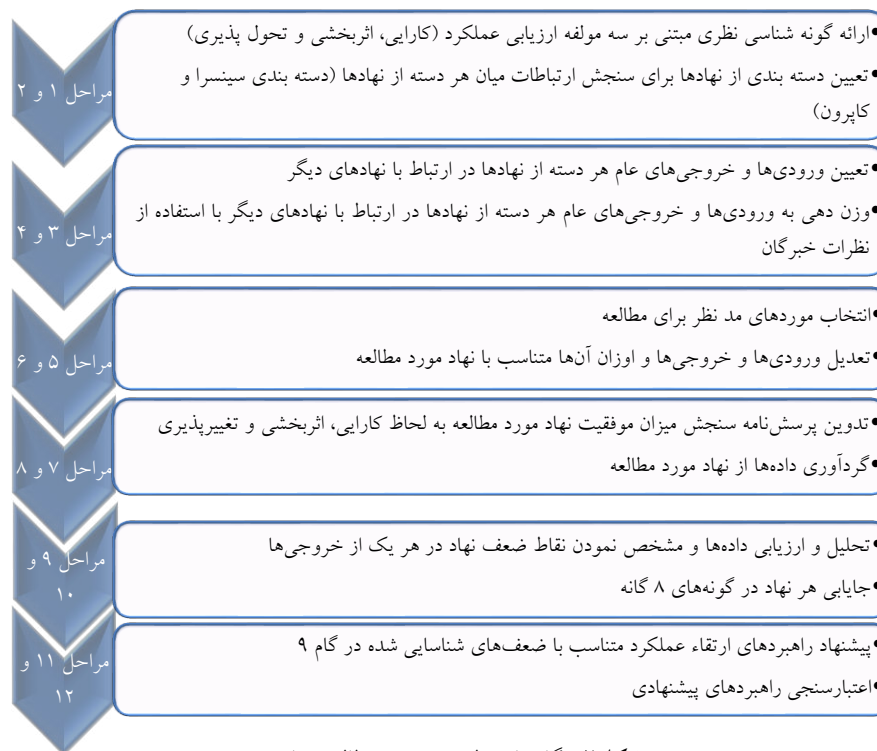
شکل ۲- گام‌های طی شده در مطالعه حاضر.

در این پژوهش، با استفاده از این الگوریتم ۱۲ مرحله‌ای، عملکرد ۸ نهاد فعال در نظام ملی نوآوری ایران ارزیابی شده و راهبردهای ارتقاء عملکرد برای آن‌ها پیشنهاد شد. در خصوص شیوه اجرای هر یک از این گام‌ها، در ادامه بخش‌های این فصل جزئیات بیشتری ذکر شده است. همچنین در خصوص شیوه روایی سنجی پرسش‌نامه و وزن‌دهی به خروجی‌های هر مورد نیز جزئیات بیشتری بیان می‌شود. خبرگان پژوهش حاضر در ۲ دسته قابل تقسیم بندی هستند: (۱) دسته اول خبرگان آگاه به مفاهیم نظام ملی نوآوری که در این دسته ۱۱ نفر از افراد اجرایی یا اعضای هیئت علمی دانشگاه که حداقل دو مقاله یا کتاب در این زمینه به چاپ رسانده بودند و (۲) حداقل ۲ خبره (و در ۳ مورد ۳ خبره) فعال در هر یک از نهادهای مورد مطالعه که در بخش‌های راهبردی سازمان مشغول به فعالیت بوده و دیدگاهی جامع نسبت به سازمان متبوع خود داشتند.