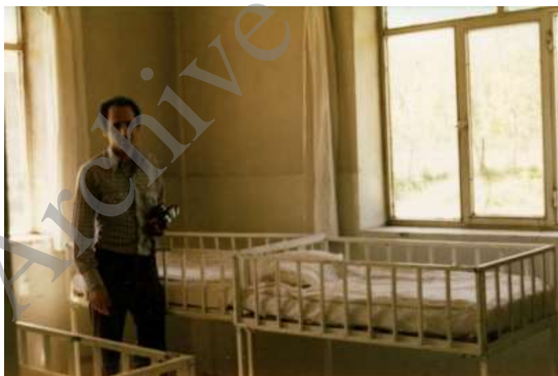
تصویر ۶- نویسنده مقاله در یکی از اتاق‌های بخش اطفال بیمارستان روستایی ده چهار تخته