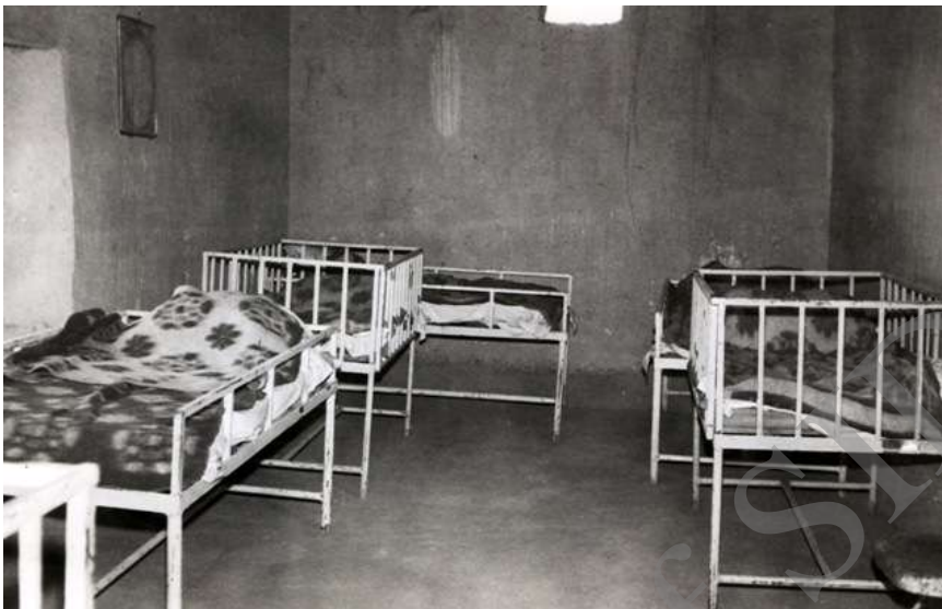
تصویر ۷- بخش مامایی و بخش اطفال بیمارستان روستای قلائی