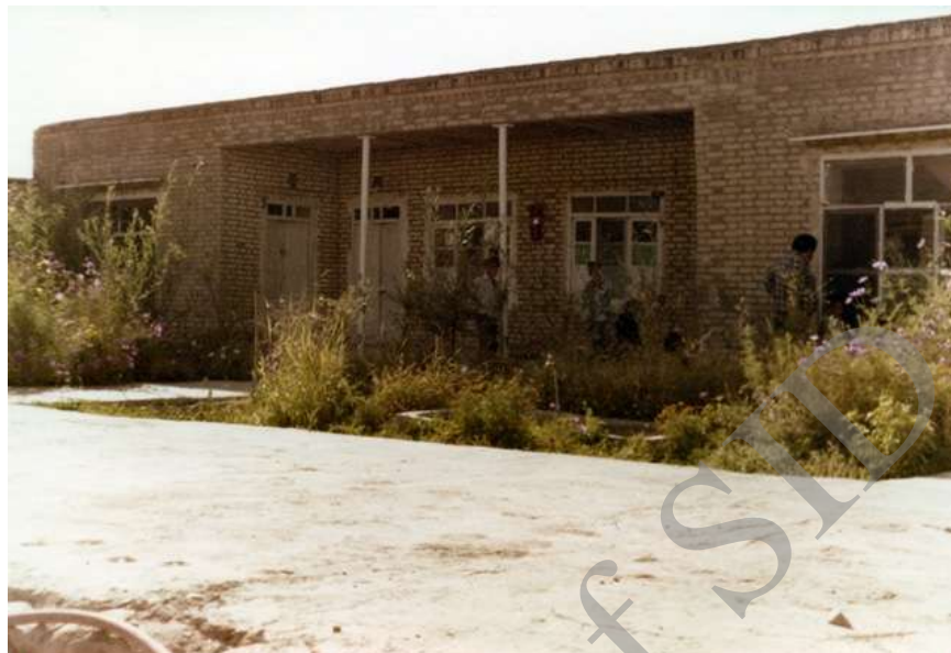
تصویر ۵- بخش عفونی و داروخانه بیمارستان روستایی ده چهار تخته