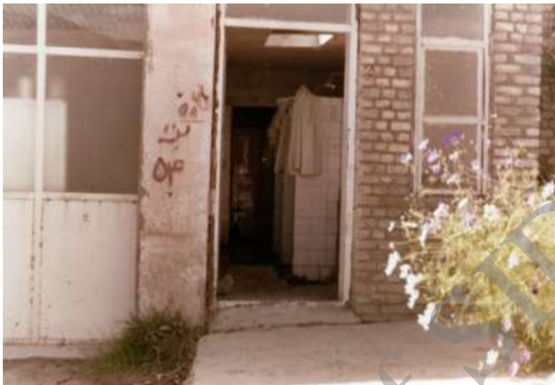
تصویر ۳- سرویس بهداشتی درمانگاه روستایی