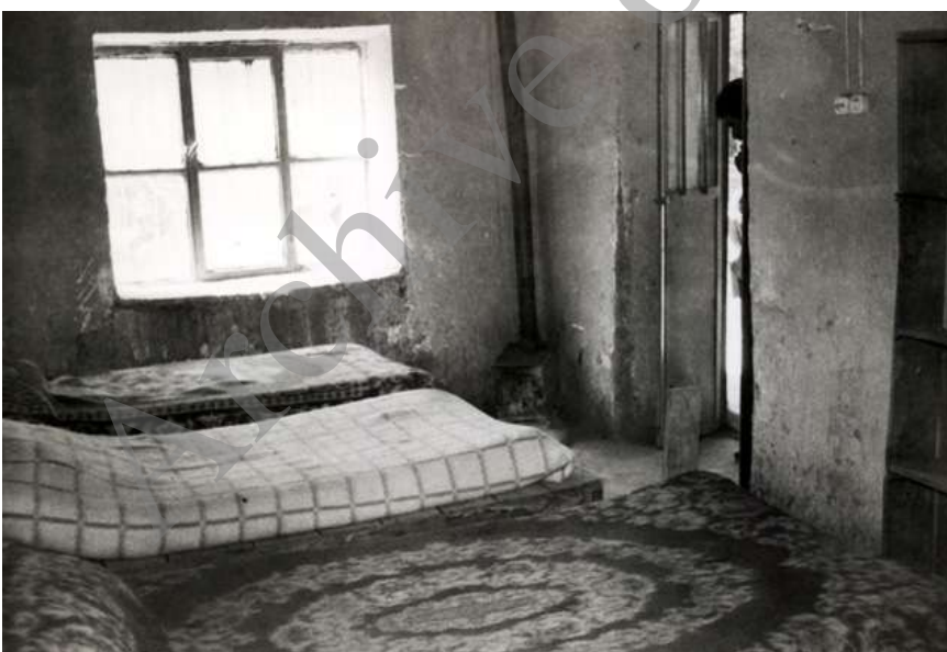
تصویر ۸- یکی از اتاق‌های بیمارستان روستایی قلائی با بخاری چوبی