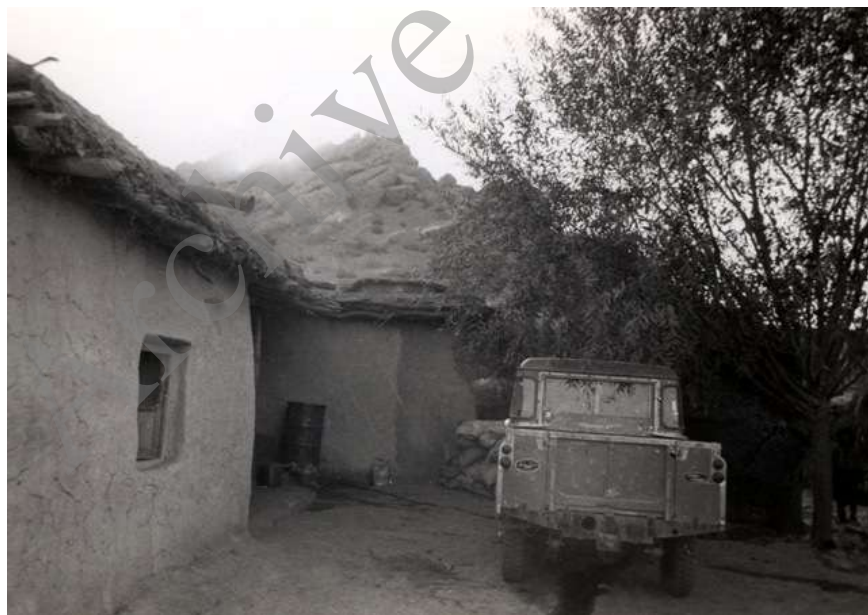
تصویر ۱۰- وسیله نقلیه درمانگاه روستایی