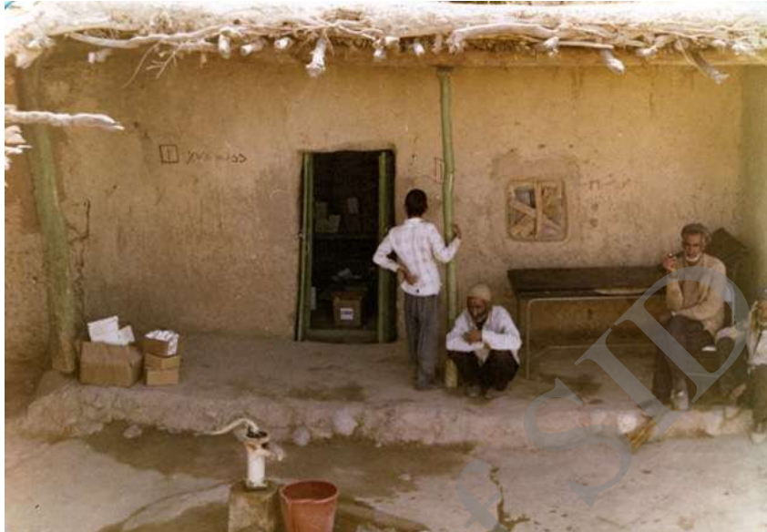
تصویر ۹- داروخانه درمانگاه روستای شینه