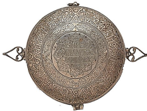
تصویر ۲: بازوبند نقره، اواسط قرن ۱۳ هجری ۶/۶ × ۲ cm ( http://jameelcentre.ashmolean.org/collection/6980/9992/0/12 ) (716#details)

دسته بزرگی از بازوبندهای طلسمی را غلاف‌های تعویذی تشکیل می‌دهند که حاوی بخش‌هایی از قرآن یا ادعیه هستند. در این آثار هیچ اشاره‌ای به نمادها و جدول‌های طلسمی نمی‌شود. از این رو، اعتقاد غالب در طراحی این آثار، تکیه بر قدرت خداوند و ائمه در رسیدن به ایمنی است؛ زیرا در باور مسلمانان، حفاظت از بیماری، بلا و مصیبت، تنها از طریق توسل به خدا و به خواست او انجام‌پذیر است (تصویر ۲).