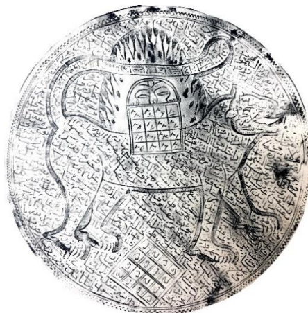
تصویر ۱۲: بازوبند نقره، اوایل قرن ۱۳ هجری ۸/۶ cm (تناولی، ۱۹۸۵: ۴۰)

ج) شیر و خورشید: در رمزپردازی‌های آیینی و ملی ایران، شیر و خورشید، نه تنها به عنوان یک نماد ملی، بلکه به عنوان یک نماد شیعی، شناخته شده و بر روی آثار مختلف کاربرد گسترده‌ای داشته است. در فرهنگ ایران از دیرباز، خورشید به عنوان مظهر خداوند و شیر نشانه قدرت و اقتدار، هر دو به خدایان مربوط بوده‌اند (یاحقی، ۱۳۷۵: ۲۸۰). در معتقدات شیعی مردم ایران، شیر و خورشید نماد مقدسی است که با شخصیت حضرت علی (ع) و پیامبر اکرم (ص) پیوسته است (خزایی، ۱۳۸۰: ۳۸). در دوره قاجاریه نقش شیر و خورشید کاربردی روزافزون یافت. اهمیت قدسی این نقش و اعتقاد مردم به خوش‌یمنی آن را می‌توان از دلایل این امر برشمرد (تصویر ۱۲).