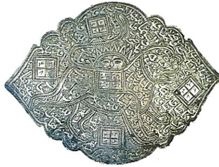
تصویر ۴: بازوبند شیر و الشمس، نقره، قرن ۱۳ هجری، ۸/۷ × ۷/۶ cm (تناولی، ۱۳۹۴: ۷۲)