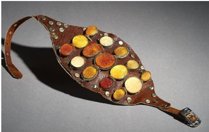
تصویر ۱: بازوبند پهلوانی، قرن ۱۳ هجری

بازوبندهای مهره‌ای تا دوره قاجار در ایران رایج بود. رسم بستن بازوبند پهلوانی نیز در این دوره ادامه داشت. بازو مهره یا بازوبند پهلوانی در دوره ناصری از جانب شاه به پهلوان پایتخت - که پشت دیگر یلان را به خاک رسانده بود - اعطا می‌شد و تا زمانی که دیگری بر او تفوق نمی‌یافت امتیاز مزبور از آن وی بود (شاملو، ۱۳۷۷: ۱۱۵۵). تصویر ۱ نمونه‌ای از این بازوبندهاست.