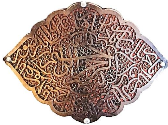
تصویر ۹: بازوبند به شکل چشم، نقره، اوایل قرن ۱۳ هجری ۷/۴ × ۹/۷ cm (تناولی، ۱۳۹۴: ۷۳)

ب) چشم: تمثیلات و عباراتی همچون چشم سر، چشم دل، چشم حق و نظایر آن، بیانگر کاربرد نمادین چشم در فرهنگ ایرانی - اسلامی است که در آن چشم به‌عنوان نماد بصیرت باطنی استفاده می‌شود. کلمه عین در سنت اسلام، علاوه بر چشم به معنی تمامیتی خاص، چشمه یا جوهر نیز هست و به‌عنوان نماد شناخت و بینش مافوق طبیعت به کار می‌رود. تک‌چشم بدون پلک، نماد جوهر و آگاهی الهی است (شوالیه و گبران، ۱۳۸۴: ۵۱۴) (تصویر ۹).