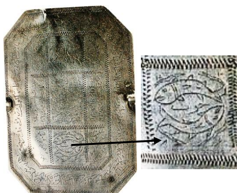
تصویر ۷: بازوند طلسمی، نقره، قاجار (خلیلی، ۱۳۸۷: ۱۱۲).

توسل به نمادهای سحرآمیز از قدیم‌ترین روش‌های درمانی در سراسر جهان است. بر این بازوندها اکثراً جدول‌هایی نقاشی شده است. در خانه‌ای از جدول، یک جفت شمایل انسانی زن و مرد و در خانه‌ای دیگر نقش جفت ماهی، یا نمادهای خورشید و ماه به‌عنوان نماد باروری و نیک‌فرجامی حکاکی شده‌اند (تصویر ۷).