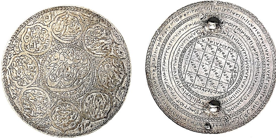
تصویر ۳: دو طرف یک بازوبند نقره، قرن ۱۳ هجری (خلیلی، ۱۳۸۷: ۱۱۳)

اگرچه در مبانی فکری مسلمانان استعانت جستن از خداوند متعال، شرطی اساسی برای غلبه بر دشمنان است؛ لیکن در بسیاری از بازوندها ضمن استفاده از آیات قرآنی: «نَصْرٌ مِنَ اللَّهِ وَ فَتْحٌ قَرِيبٌ» (صف/۱۳/۶۱) و «إِنَّا فَتَحْنَا لَكَ فَتْحًا مُّبِينًا» (فتح/۱/۴۸) جهت تأثیرگذاری بیشتر، از جدول‌ها و نقوش طلسمی نیز استفاده شده است (تصویر ۳).