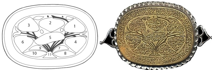
تصویر ۱۴: بازوبند عقیق، دوره قاجار، همراه با جزئیات

و) نباتی: درخت‌های مقدس همراه با اساطیر و آیین‌های مربوط به آن بخش مهمی از مذهب، تاریخ، باورهای قومی و روایت‌های مردمی رایج در سرتاسر جهان را تشکیل می‌دهند. درخت جاودانگی، هوم سپید، درخت هزار تخمه، درخت گوکرن (همان، ۶۵، ۸۷)، درخت معرفت (بقره/ ۳۵/۲)، درخت مریم یا نخل (مریم/ ۱۹/ ۲۳)، و شجر اخضر (یس/ ۳۶/ ۸۰)، نمونه‌هایی از معروف‌ترین درختان مقدس شناخته‌شده در فرهنگ ایرانی - اسلامی پیش و پس از اسلام هستند. نقوش گیاهی در بازوبندها خیلی مورد استفاده نبوده است و در مواردی معدود، به‌شکل نوعی درخت یا گیاه ریواس و نظایر آن مشاهده می‌شود (تصویر ۱۴).