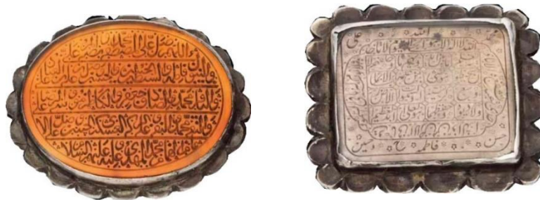
تصویر ۱۷: جزئیات تصویر شماره ۱۶

بسیاری از تعویذها و بازوبندها رایج بود (تصویر ۱۶).