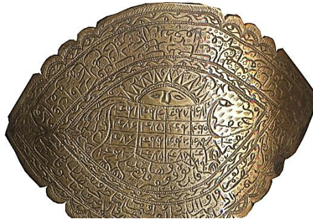
تصویر ۲۲: بازوبند شیر و خورشید، قرن ۱۳ هجری برنج https://www.britishmuseum.org/research/collection_online/collection_object_details.aspx?objectId=218042&partId=1&searchText=qajar&images

ج) اعداد: در بسیاری از موارد رمالان و دعانویسان به جای حروف، از معادل عددی آن‌ها استفاده می‌کردند. کاربرد اعداد بر روی بازوندها بسیار گسترده بود (تصویر ۲۲).