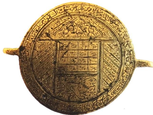
تصویر ۵: بازوبند طلسم و دعا، برنج، اوایل قرن ۱۳ ه، ۴/۸ cm، مأخذ: (تناولی، ۱۳۹۴: ۷۵)