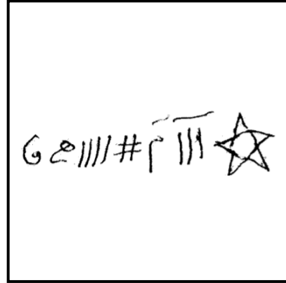
تصویر ۲۰: بازوبند نقره، قرن ۱۳ هجری (خلیلی، ۱۳۸۷: ۱۱۳)