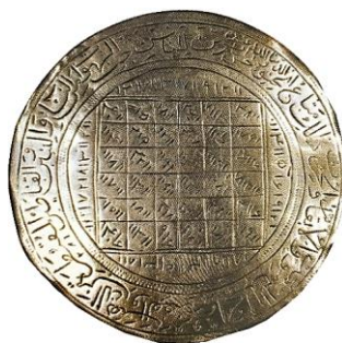
تصویر ۲۳: بازوبند نقره، قرن ۱۴ هجری، cm ۶/۷ (تناولی، ۱۳۹۴: ۷۴)

د) مربعات جادویی: در این نوع طلسم که بیشتر بر جدول و عدد استوار است، از مجموع چند عدد، به جدول‌هایی می‌رسیدند که به مربعات جادویی مشهور است (عزیزی فر، ۱۳۹۲: ۹۰). اعداد مفروض را از حروف سوره‌های قرآن می‌گرفتند و آن‌ها را در جدول‌های مختلف قرار می‌دادند و برای رسیدن به اهداف و خواسته‌های متفاوت به کار می‌بردند (تصویر ۲۳).