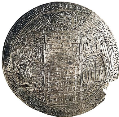
تصویر ۶: بازوبند طلسمی، نقره، قاجار، ۷/۱ cm (تناولی، ۱۳۹۴: ۷۴)

رسیدن به سعادت، عاقبت به خیری و به دست آوردن نعمت‌ها و لذت‌های دنیوی از دیگر مواردی است که بر بازوبندها نقش شده است. برای این منظور اغلب آیه ۱۴ سوره آل عمران که در آن به امور مادی و تعلقاتی همچون زنان، فرزندان، اموال هنگفت، اسب‌های ممتاز، چهارپایان و زراعت اشاره شده است، استفاده می‌شد (تصویر ۵).