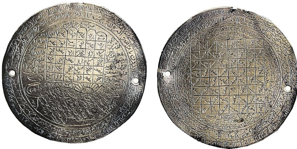
تصویر ۱۵: دو طرف یک بازویند نقره، اوایل قرن ۱۴ هجری (تناولی، ۱۳۹۴: ۷۵).

الف) اسماء الهی: پیشینیان بر این باور بودند که میان نام، ذات و نیروهای واقعی پیوندی عمیق و استوار برقرار است، به‌گونه‌ای که گویی این دو، یعنی اسم و ذات، مفهوم و بوده‌ای یگانه‌اند و از همین روی با دانستن نام واقعی کسی یا چیزی می‌توان آن را در اختیار گرفت (سرکاراتی، ۱۳۷۷: ۲۲). در نزدیکی به همین مضمون و با استناد به آیه قرآنی «لله اسماء الحسنی فادعوه بها» (اعراف/ ۷/ ۱۷۹) در بسیاری از طلسم‌ها و تعاویذ از اسامی خداوند استفاده شده است (تصویر ۱۵).