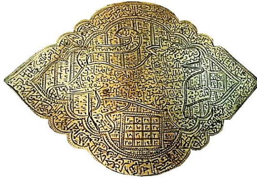
تصویر ۱۰: بازوبند با نقش شیر، نقره، قرن ۱۳ هجری (تناول، ۱۳۹۴: ۷۲)

الف) شیر: شیر مظهر قدرت، توان و نیرو بوده است و در روزگار باستان، به-منزله مظهر و نماینده خورشید شناخته می‌شد. این نقش از پرتکرارترین نقوش در هنر ایران پیش و پس از اسلام است. نقش شیر به‌تنهایی و یا همراه با خورشید، پس از اسلام دارای معانی مذهبی است. در بسیاری از این آثار نقش شیر، نماد حضرت علی (ع) بوده و شاخص‌ترین نماد شیعی به‌کار رفته در آثار مختلف هنر شیعی است (خزایی، ۱۳۸۰: ۳۸) (تصویر ۱۰)