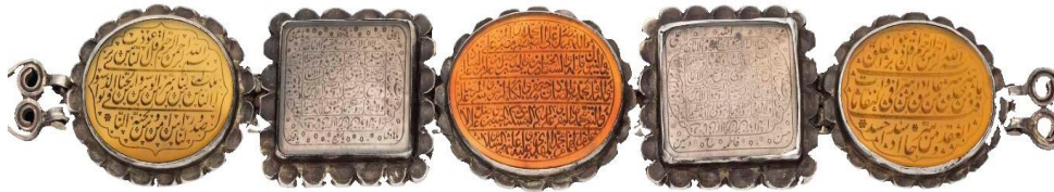
تصویر ۱۶: بازوبند نقره با سنگ‌های قیمتی، قرن ۱۳ هجری

ج) اسامی اهل بیت (ع) و صلوات: توسل به ائمه از محوری‌ترین عقاید شیعیان برای رسیدن به حاجات است. از این رو نوشتن اسامی اهل بیت (ع) و صلوات، بر روی