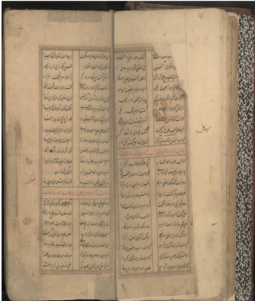
تصویر ۱: «ولایت‌نامه» در جنگ ۳۵۲۸ دانشگاه تهران

بخش مقدمه، تنه اصلی قصیده و شریطه زبان شعر ساده و نرم است. ذکر داستان یکی از عناصر اصلی این نوع ادبی است که در تنه اصلی قصیده جای دارد و شاخصه اصلی این داستان آن است که در ذکر کرامات و معجزات حضرت علی (ع) است. این گونه ادبی به فرهنگ شیعیان اختصاص دارد و بیشتر در شأن حضرت علی (ع) سروده شده است.