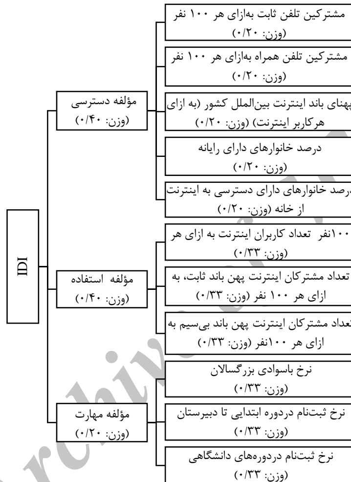
شکل (۱): IDI و مؤلفه های آن