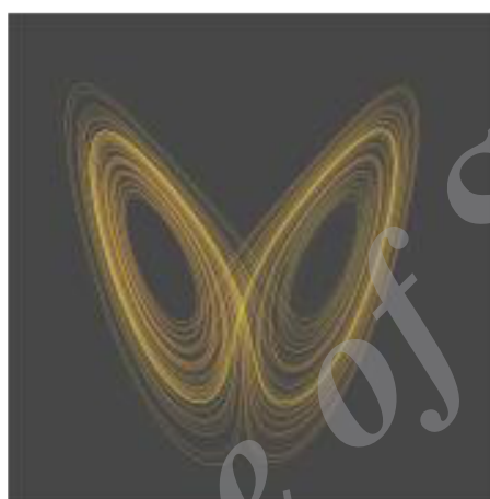
شکل 2 اثر پروانه‌ای

مشخصه مهم سیستم‌های آشوبی، حساسیت آنها به شرایط اولیه است. اثر پروانه‌ای در واقع بیانگر رد روابط خطی بین علت و معلول و تأیید غیر خطی بودن روابط در پدیده‌ها و سیستم‌ها است (شکل 2).