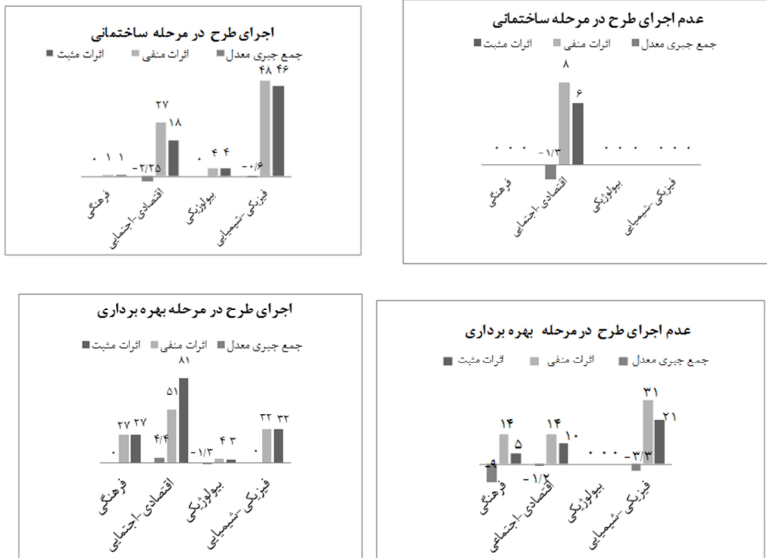
شکل ۲: جمع‌بندی اثرات مثبت و منفی و جمع جبری معدل برای ماتریس لئوپولد تغییر یافته برای مراحل ساختمانی و بهره‌برداری

منفی برای ارزیابی هر گزینه بیان شد که میزان این اثردهی در نمودار (۲) به تفکیک نشان داده شده است. نتایج نهایی به صورت مقایسه کلی برای هر دو مرحله ساختمانی و بهره‌برداری برای اجرای طرح و عدم اجرای طرح در شکل ۳ نشان داده شده است.