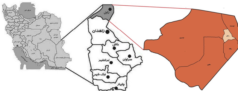
شکل ۱: موقعیت جغرافیایی منطقه سیستان در استان سیستان و بلوچستان و کشور ایران