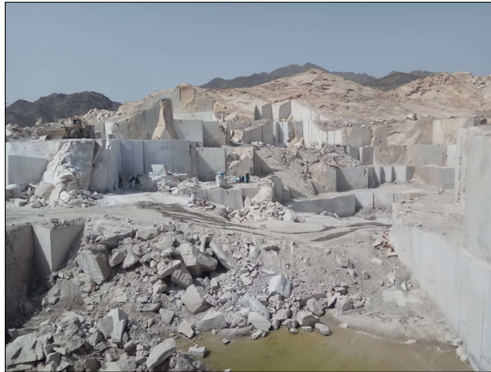
شکل ۲: نمایی از معدن گرانیت بوگ