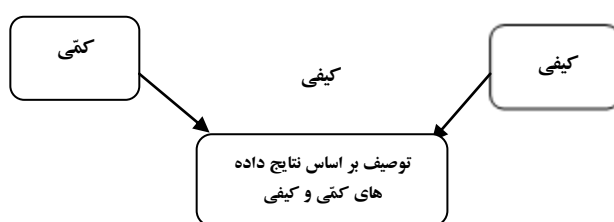
شکل ۲. طرح به هم تنیده

طرح‌های به هم تنیده برای مقایسه مستقیم نتایج داده‌های آماری با نتایج داده‌های کیفی یا تأیید نتایج کیفی با داده‌های کمی به کار می‌رود. به عنوان مثال، در مطالعه موردی در حوزه حقوق که توسط مجمع بین دانشگاهی فلاندرز برای ارزیابی عملکرد پژوهشی در علوم اجتماعی و علوم انسانی انجام شد، دو پرسش‌نامه تهیه گردید که اولین آن به گردآوری داده‌های کمی دربارهٔ بیشتر فعالیت‌های دانشگاهی و دومین آن با استفاده از سه طیف «برجسته»، «خوب ولی نه برجسته» و «نسبتاً خوب» به گردآوری نظرات پاسخ‌دهندگان دربارهٔ مجلات به همراه اسامی پژوهشگران فلاندرزی می‌پرداخت. در نهایت، براساس داده‌های استخراج شده از پرسش‌نامه دوم، به ارزیابی میزان انطباق نظرات این پژوهشگران با برون‌دادهای حاصل از شاخص‌های کمی پرداختند. البته شایان ذکر است که هسته اصلی کار با فهرست انتشاراتی که پژوهشگران خود برطبق نوعی دسته‌بندی مشتمل بر ۱۸ نوع گروه‌بندی آن را تهیه کرده بودند، پی‌ریزی شد (موثد، ۱۳۸۷). در واقع، می‌توان گفت که ارزیابی نتایجی که از پرسش‌نامه دوم به دست آمده، دربردارندهٔ داده‌های کیفی است و مقایسهٔ آن با نتایج پرسش‌نامه اول که شامل داده‌های کمی است نمونه‌ای از طرح‌های به هم تنیده در روش تحلیل استنادی است. در شکل ۲ می‌توان فرایند این طرح را مشاهده کرد: