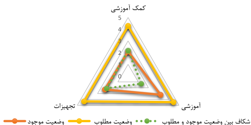
شکل (۱) شکاف وضعیت موجود و مطلوب عدالت آموزشی در مدارس دولتی شهر تهران

بر اساس نتایج جدول (۹)، با توجه به مقدار t که در مؤلفه‌های مورد مطالعه در سطح 0/05 معنادار ( p = 0/001 ) است؛ بنابراین فرض صفر رد و فرض پژوهش تأیید می‌شود. از آنجاکه میانگین وضعیت موجود در مقایسه با میانگین وضعیت مطلوب در حد پایین‌تری قرار دارد، بنابراین به‌روشنی می‌توان دریافت، بین وضعیت موجود و مطلوب «عدالت آموزشی در مدارس دولتی شهر تهران» شکاف وجود دارد.