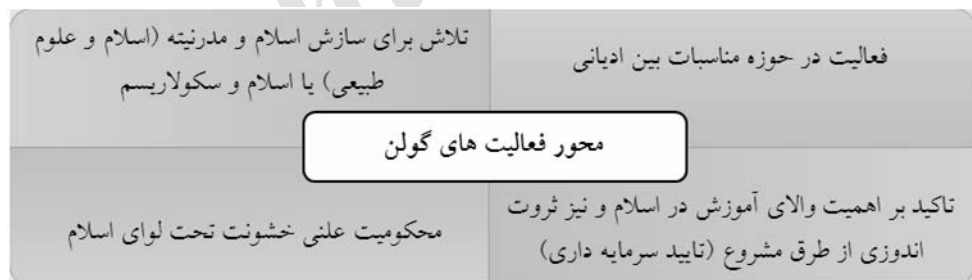
شکل ۲: محور فعالیت‌های گولن

برخی از مهم‌ترین آثار گولن عبارت‌اند از: از قرآن به ادراک (دو جلد) ، عصر و نسل ، مضرب شکسته ، مجموعه دعاها ، موازین یا چراغ‌های بر فراز راه ، از فصلی به فصل دیگر و تپه‌های زمردین قلب ؛ کتاب جدید او را نیز که مجموعه‌ای از مقالات و سخنرانی‌های او درخصوص خشونت، جنگ و تروریسم است، شاگردانش جمع‌آوری کرده و با عنوان مسلمانان و مسئولیتشان در مواجهه با خشونت انتشار داده‌اند؛ محور فعالیت‌ها و پس‌زمینه فکری آنها به‌صورت طرح کلی (شماتیک) در زیر آورده شده‌است: