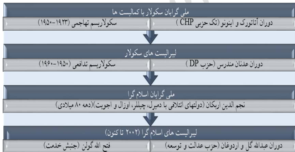
شکل ۳: روند گفتمان‌های سیاسی در ترکیه مدرن

تفسیر متفاوت از ملی‌گرایی را ارائه دادند. آکچورا مهاجر ترک‌تبار روسی همانند سایر همفکرانش در اندیشه ارتباط ترک‌های آناتولی با جهان ترک بود؛ در مقابل، گؤک‌آلپ از نوعی ملی‌گرایی آناتولیایی دفاع می‌کرد (کؤشه‌بالابان، ۱۳۹۲: ۹۹). آکچورا معتقد بود که ترک‌گرایی به‌نسبت اسلام‌گرایی در سیاست خارجی، بهتر عمل می‌کند و حساسیت اروپایی‌ها را کمتر برمی‌انگیزد (آکچورا، ۱۹۰۴: ۸-۹). گؤک‌آلپ، میان فرهنگ و تمدن، تمایز قائل می‌شد. «فرهنگ»، عنصر اصلی سازنده هویت ملی و «تمدن»، امری عمومی تلقی می‌شد که دیدگاهی عمل‌گرایانه‌تر بود که به ظهور کمالیسم انجامید. سه راه سیاست آکچورا اگرچه از سقوط امپراتوری عثمانی جلوگیری نکرد، اساس هویت ملی ترکیه مدرن را شکل داد که متعاقب آن، قانون اساسی جمهوری ترکیه در سال ۱۹۲۱ تدوین شد و در ۲۹ اکتبر ۱۹۲۳ (۶ آبان ۱۳۰۲)، حکومت از سلطنت (پادشاهی) به جمهوری تغییر یافت؛ بدین ترتیب، تقابل اسلام و سکولاریسم از یک‌سو و لیبرالیسم و ناسیونالیسم از سوی دیگر، چهار گفتمان عمده سیاست در ترکیه را شکل دادند که به‌صورت طرحی کلی در زیر آورده شده است: