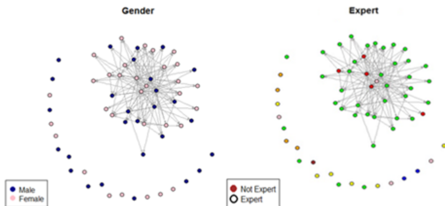
شکل ۳: همگرایی اعضای شبکه همکاری علمی مشاهده شده بر حسب جنسیت و تخصص