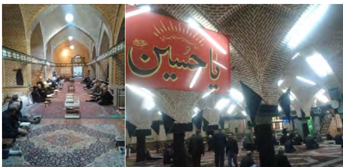
شکل ۴: مجلس روضه در مسجد مقبره (راست) قرائت قرآن در مسجد امام جمعه (چپ) (نگارنده)