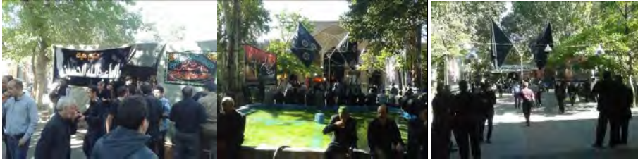
شکل ۸: سرمایه فرهنگی و اجتماعی؛ مراسم پخش نذری در سرای امیر در محرم ۱۳۹۵ (نگارنده)

سراهای بازارهای تبریز به عنوان فضاهای خالی و باز که در کل بافت بازار بطور متعادلی توزیع شده‌اند. شبکه سراها با نظمی همچون شبکه شطرنجی امکان بارگیری و باراندازی کاروانها برای نقاط دلخواه بازار را در گذشته بخوبی فراهم می‌کرده‌اند. اندازه سراها نسبتا از سایر فضاها همچون تیمچه‌ها و مساجد بزرگتر هستند و وجود پوشش گیاهی و حوض آب در برخی از آنها نظم فضایی_کالبدی با استفاده از طبیعت را فراهم نموده است.