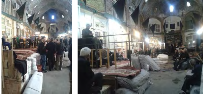
شکل ۶: سرمایه اجتماعی در مراسم روضه در تیمچه‌های سه گانه حاج شیخ در محرم ۱۳۹۵ (نگارنده)

پرداخته و نذر واحسان کسبه تیمچه با پذیرایی از عزاداران (صبحانه، چای، خرما و ...) انجام می‌شود.