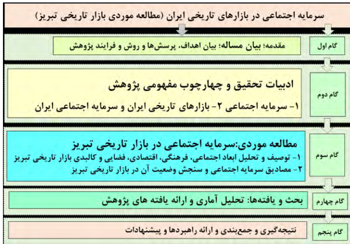
شکل ۱: دیاگرام فرایند انجام پژوهش (نگارنده)

آن بروش پیمایش میدانی از نظر مردم و کسبه ارزیابی گردیده و پس از تحلیل آماری و یافته‌ها، جمع بندی و نتیجه‌گیری شد. این فرایند در دیاگرام شکل ۱ قابل ملاحظه است.