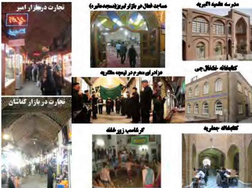
شکل ۷: مراکز و فضاهای فرهنگی، مذهبی، اقتصادی و اجتماعی بازار تبریز (نگارنده)