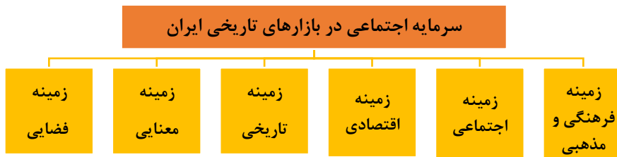
شکل ۲: ابعاد سرمایه اجتماعی در بازارهای تاریخی در زمینه‌های شش‌گانه (نگارنده)

با توجه به ویژگیهای چندگانه بازارهای تاریخی که هر جزئی از آن بستر تجلی سرمایه‌های اجتماعی سنتی ایرانی اسلامی است، می‌توان سرمایه اجتماعی بازارهای تاریخی، را در شش زمینه زیر بطور جامع مطالعه نمود: ۱- زمینه فرهنگی و مذهبی ۲- زمینه اجتماعی ۳- زمینه اقتصادی ۴- زمینه تاریخی ۵- زمینه معنایی ۶- زمینه فضایی (شکل ۲).