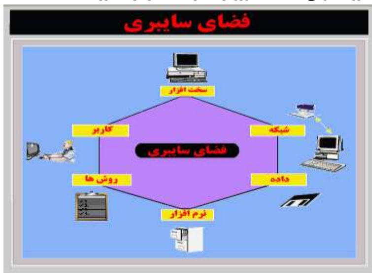
شکل (۱) بخش‌های حیاتی فضای سایبر (کورویل شین، به نقل از نصیرزاده، ۱۳۹۶)

انستیتو مطالعات امنیتی شرق- غرب آمریکا و انستیتو اطلاعات دانشگاه دولتی مسکو در تعریفی مشترک فضای سایبر ۲ را محیطی الکترونیکی عنوان نموده‌اند که از طریق آن اطلاعات تولید، ارسال، دریافت، ذخیره، پردازش و حذف می‌شود. فضای سایبری به فضایی اشاره دارد که با استفاده از فناوری اطلاعات و ارتباطات و شبکه‌ها، اجزا و ساختارهای آن یا بر پایه تخیل‌ها فاقد مبنای واقعی و یا بر پایه واقعیت‌های شبیه‌سازی شده طراحی و ابداع می‌گردد. (حافظ نیا، ۱۳۹۰) برابر اسناد راهبردی نیروی هوایی آمریکا، بخش‌های حیاتی فضای سایبری در شش حوزه اصلی قرار گرفته‌اند. در این میان سه حوزه (کاربر، روش‌ها و داده) توسط نیروی هوایی قابل کنترل هستند. سه ناحیه باقی‌مانده (نرم‌افزار، شبکه‌ها و سخت‌افزار) به دلیل آسیب‌پذیری باعث نگرانی وزارت دفاع و نیروی هوایی شده‌اند (کورویل شین ۳ ، به نقل از نصیرزاده، ۱۳۹۶).