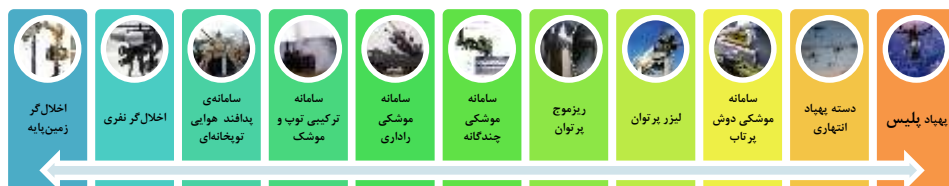
شکل (۱) نمودار سبب محصولات ضد پهپاد

جهت تعیین وزن دهی به معیارها، فرآیند استفاده از ماتریس مقایسه زوجی انتخاب شد. در ضمن گزینه‌های مناسب جهت تعیین سبب محصولات ضد پهپاد برای ارائه به خبرگان در پرسش‌نامه نیز تدوین شدند (شکل ۱). در جدول (۴) نقاط قوت و ضعف گزینه‌های پیشنهادی که به خبرگان داده شده، آمده است.