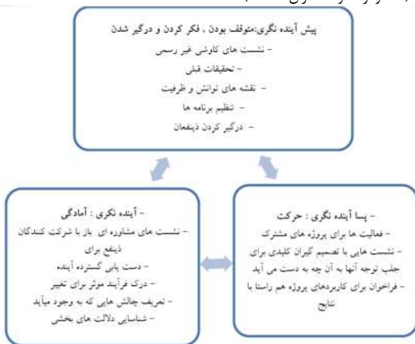
شکل (۱) چگونگی و ترتیب اجرای فرآیند آینده‌نگاری

پژوهش دیگری، فرآیند آینده‌نگاری فوق را در چارچوب پیشنهادی که از سه بخش بافتار داخلی، خارجی، فرایند آینده‌نگاری و زنجیره ارزش تشکیل شده است، برابر شکل زیر ارائه می‌نماید (محمودزاده و همکاران، ۱۳۹۶):