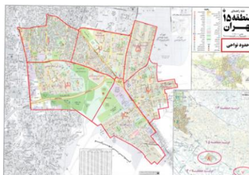
شکل ۱. نقشه‌ی محدوده‌ی مناطق شهرداری تهران و

موقعیت نواحی هشت‌گانه منطقه ۱۵ تهران (www.avval.ir)