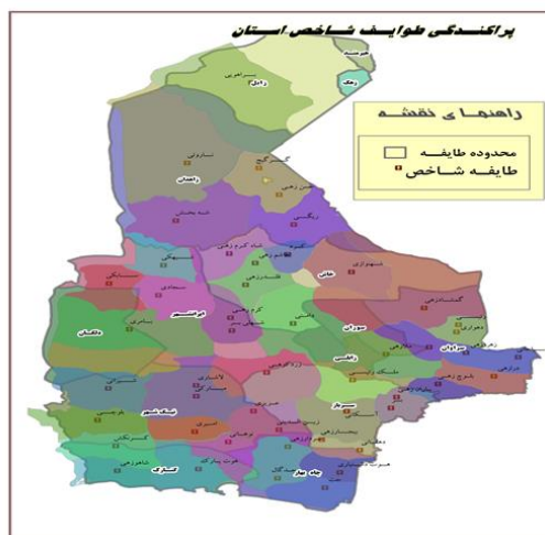
شکل شماره‌ی ۲: نقشه پراکندگی طوایف استان

بر اساس آمار در بیش از ۲۵۶ طایفه گوناگون در استان گسترش یافته‌اند که بسیاری از آنها با آداب و رسوم خاص دارای سازمان اجتماعی و هرم قدرت مشخصی می‌باشند و با پیروی از یکسری رفتارهای درون‌گروهی و برون‌گروهی در بسیاری از موارد در تقابل با قوانین قضایی و مصالح ملی نظام قرار می‌گیرند که در نتیجه موجب شکل‌گیری بسترهای ناامنی در استان می‌شود. از تعداد طوایف مذکور نزدیک به ۱۲۰ طایفه در منطقه سیستان (شهرستان‌های زابل، زهک، هیرمند و بخش‌هایی از زاهدان) و بیش از ۱۳۶ طایفه در منطقه بلوچستان در شهرستان‌های زاهدان، خاش، سراوان، ایرانشهر، سوران، زابلی، دلگان، نیک‌شهر، کنارک، سرباز و چابهار پراکنده می‌باشند. (کریمی‌پور، ۱۳۷۱، ۱۶ تا ۱۰)