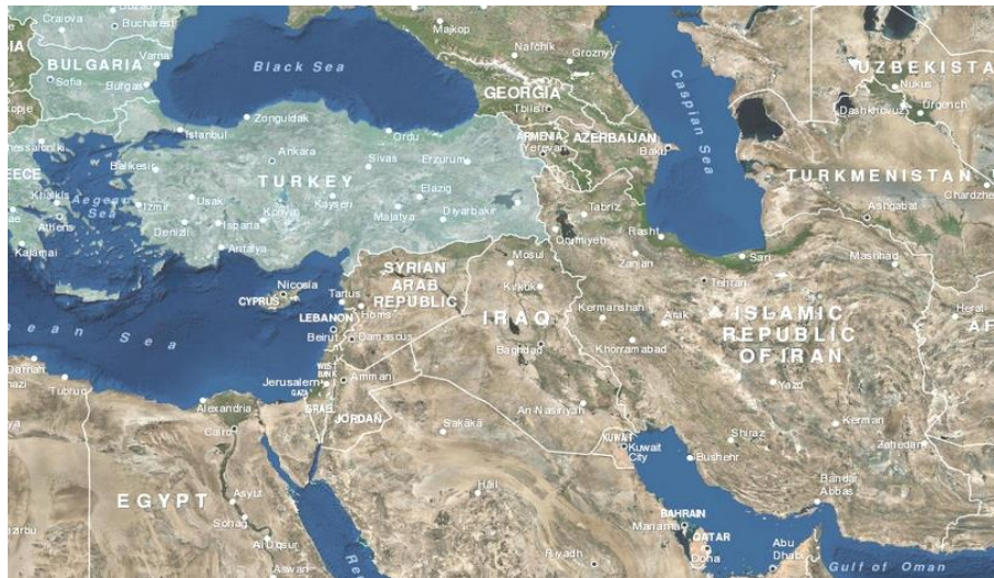
تصویر ۴: اعضای رسمی ناتو در مناطق ژئوپلیتیکی غرب ایران (www.nato.int)

به‌عنوان یکی از ۲۸ عضو رسمی ناتو شناخته می‌شود و در زمینه امنیت با آن سازمان تشریح مساعی می‌کند. ناتو، که با هدف اولیه تأمین امنیت منطقه جغرافیایی آتلانتیک شکل گرفت در مفهوم نوین امنیتی خود اذعان می‌کند که امنیت منطقه آتلانتیک زمانی تأمین خواهد شد که مرزهای جغرافیایی این سازمان جای خود را به مرزهای هویتی دهد (Dempsey, 2010) و بر این اساس است که کشور ترکیه با قرارگیری در منطقه آناتولی و اینکه تنها سه درصد از مرزهای جغرافیایی آن در منطقه یورو قرار دارد و همچنین با داشتن دین رسمی اسلام، که هنوز اتحادیه اروپا از پذیرش آن خودداری ورزیده است در مرزهای هویتی ناتو قرار گرفته است و یکی از مهمترین اعضای آن به‌شمار می‌آید.