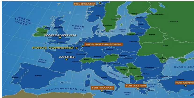
تصویر ۸: پایگاه‌های استقرار سامانه اشتراک اطلاعات، نظارت و شناسایی (www.e3a.nato.int)