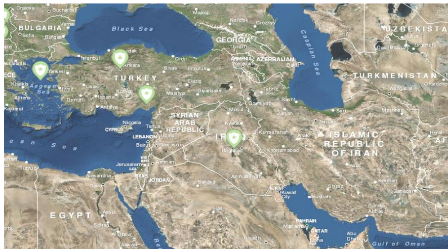
تصویر ۶: مأموریت‌های بشردوستانه ناتو در مناطق ژئوپلیتیکی غرب ایران، (www.nato.int)

یکی دیگر از راهبردهای ناتو برای فلمروسازی در سطح جهان و از جمله در مناطق ژئوپلیتیکی غرب ایران، مأموریت‌های به اصطلاح بشردوستانه این سازمان است. پایه و اساس ناتو در سال ۱۹۴۹م. انواع فعالیتها برای حفظ صلح و امنیت در منطقه یورواتلانتیک (مولایی و غلامی، ۱۳۹۳: ۳۴) بود که عملیاتهای مختلف، تمرینهای آموزشی در مقیاسهای مختلف، برنامه‌های آموزشی، حمایت‌های دفاعی هوایی، عملیاتهای شناسایی و گشت‌زنی، کمک به بلاای طبیعی و غیره نمونه‌هایی از این مأموریتها به‌شمار می‌آید. هر چند اولین مأموریت بشردوستانه عمده و رسمی ناتو در سال ۱۹۹۴م. و در جریان بحران بالکان و در بوسنی و هرزگوین رقم خورد، سرعت و تنوع مأموریت‌های بشردوستانه این سازمان افزایش چشمگیری داشته تا جایی که ناتو بسیاری از مأموریت‌های خود را به حوزه‌های تلاش برای حفظ صلح، آموزش و پشتیبانی لجستیکی و نظارت و کمک‌های بشردوستانه گسترش داده است (Børgensen, 2011) که تلاشی ملموس در جهت افزایش زمینه‌های فلمروسازی این سازمان در مناطق مختلف جهان به شمار می‌آید.