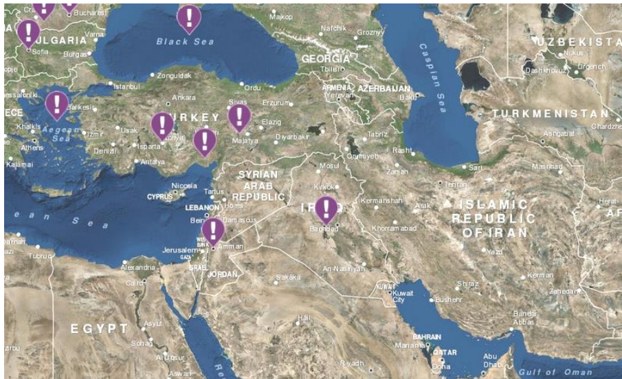
تصویر ۷: همکاریهای دفاعی و امنیتی ناتو در مناطق ژئوپلیتیکی غرب ایران (www.nato.int)