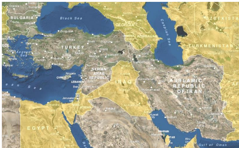
تصویر ۵: اعضای غیررسمی ناتو در مناطق ژئوپلیتیکی غرب ایران

از دیگر راهبردهای ناتو برای فلمروسازی، که در مناطق ژئوپلیتیکی غرب ایران نیز با قوت پیگیری می‌شود، گسترش مرزهای سیاسی غیررسمی سازمان است که ناتو آن را از طریق ابزار مشارکت و همکاری با تعدادی از کشورها دنبال می‌کند. در سوّمین مفهوم نوین امنیتی پیمان آمده است که ناتو برای ترویج امنیت و ثبات منطقه یورواتلانتیک با شبکه‌ای گسترده شامل بیش از ۴۰ کشور غیر عضو و سازمان بین‌المللی، که از مرکز و شرق اروپا تا صحرای غربی آسیا و اقیانوس آرام گسترده شده‌اند و درخواست عضویت در سازمان را دارند، مشارکت، و از آنها به‌عنوان «شریک» یاد می‌کند (بند ۱۲ مفهوم نوین امنیتی ناتو) (Stoltenberg, 19 May 2016). شراکت و همکاری مرحله‌ای مهم در فرایند تبدیل شدن کشورها به اعضای رسمی ناتو است.