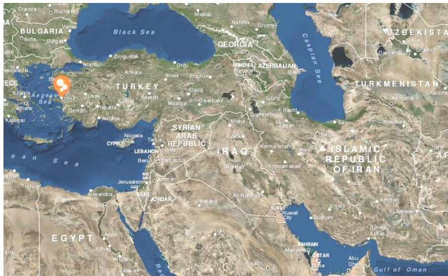
تصویر ۹: گسترش دفترهای سازمانی و اداری ناتو در مناطق ژئوپلیتیکی غرب ایران (www.nato.int)

هدایت فعالیت‌های زمینی نیروهای ناتو را در اختیار دارد به عقیده بسیاری از کارشناسان، جزو سه مورد از مهمترین اجزای سازمان پیمان آتلانتیک شمالی به‌شمار می‌آید. کارمندان و اعضای این دفتر از نیروهای متخصص و آموزش‌دیده تمامی اعضای سازمان هستند.