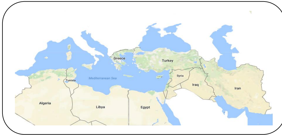
تصویر ۲: نقشه جغرافیای غربی نزدیک و دور ایران (نگارندگان)

برای مشخص شدن منطقه‌های ژئوپلیتیکی غرب ایران، اشاره به کلان منطقه ژئوپلیتیکی جنوب غرب آسیا ضروری است. جنوب غربی آسیا، که ایران نیز بخشی از آن به شمار می‌رود از چند منطقه ژئوپلیتیکی شکل گرفته است که این مناطق یا وجود دارد و یا بر مبنای ویژگی‌های درونی در حال تکوین به منطقه‌ای ژئوپلیتیکی است. یکی از منطقه‌بندی‌های شاخص در کلان منطقه جنوب غرب آسیا بر مبنای متغیر فرهنگی انجام پذیرفته است و این کلان منطقه را به سه منطقه تورانی، ایرانی و سامی تفکیک می‌کند (رومینا، ۱۳۹۲: ۷).