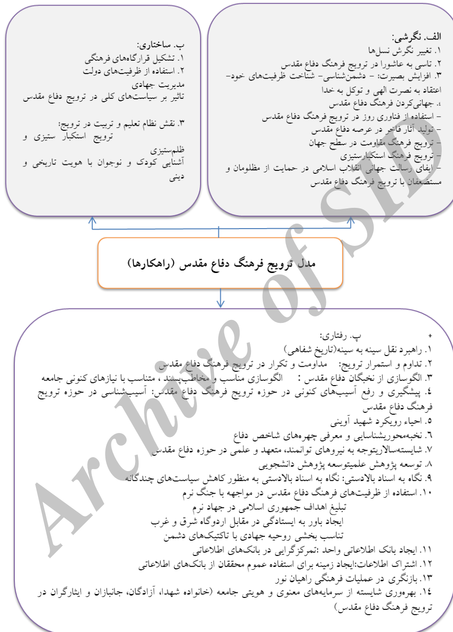
مدل ۲: ترویج فرهنگ دفاع مقدس.