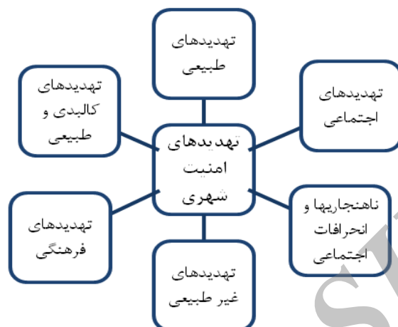
نمودار ۱: تقسیم بندی تهدیدهای امنیت شهری (رضوان، ۱۳۸۵: ۵۲)