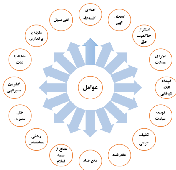
شکل ۱. مدل مفهومی عوامل مؤثر در شکل‌گیری جنگ از منظر مبانی ارزشی و آموزه‌های دینی (نگارنده: ۱۳۹۸)

از عوامل شانزده‌گانه مستخرجه از مبانی ارزشی و آموزه‌های دینی مؤثر در شکل‌گیری جنگ اعم از جنگ پیشگیرانه، پیش‌دستانه و دفاع در جنگ تحمیلی این واقعیت قابل استنباط است که شکل‌گیری پدیده جنگ در مکتب سعادت بخش اسلام ناب با سایر مکاتب دینی تحریفی و مادی تفاوت ماهوی دارد. عوامل شانزده‌گانه فوق، مضاف بر منطبق‌بودن با فطرت انسان، و تبیین اصول و قواعد رزم برای فرماندهان و رزمندگان صحنه نبرد است که حضرت امام چنین تبیین فرمودند: «...می‌گوید مراکز نظامی عراق را، و یک بمب در شهرهای عراق نمی‌اندازد. این کشور اسلامی است این لشکر اسلامی است این قوای مسلحه اسلامی است» (صحیفه، ج ۱۴: ۲۷۹ - ۲۸۰).