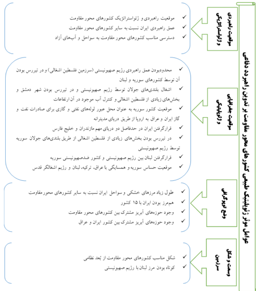
شکل ۲. مدل مفهومی تحقیق