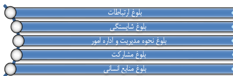
شکل ۲. الگوی یکپارچه‌سازی و هدایت مؤلفه‌های قدرت ملی (مرادیان، ۱۳۹۶)

اگر مردم احساس کنند در معرض آسیب قرار گرفته‌اند، در مورد اینکه آیا بازهم مایل به کمک هستند یا خیر، مسئله اعتماد مطرح می‌شود. کاهش میزان اعتماد متقابل و از بین رفتن حس مشارکت (که فقدان «سرمایه اجتماعی» خوانده می‌شود) به مثابه عنصر ضد بسیج منابع عمل می‌کند. لذا شاید در میان مجموعه ارزش‌های اجتماعی، اعتماد بزرگ‌ترین و بنیادی‌ترین سرمایه اجتماعی است. بقا و دوام یک اجتماع (در سطح خرد یا کلان) نیازمند اعتماد است؛ زیرا اجماع کنشگران در مواجهه با خطر یا بحران، محتاج اعتمادی است که اولاً، آحاد جامعه در روابط متقابلشان نسبت به یکدیگر دارند و ثانیاً، شهروندان در مناسباتشان با نظام سیاسی، برقرار می‌کنند. (مرادیان، ۱۳۹۴: ۷).