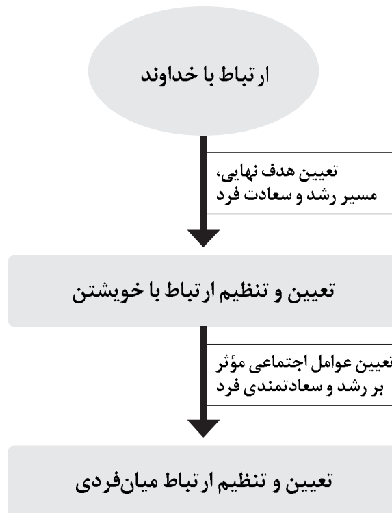
نمودار ۱. رابطه طولی میان سه سطح ارتباطی

به نظر می رسد که با عنایت به هدف نهایی زندگی در اسلام که همانا قرب به خداوند متعال می باشد (فتحعلی، ۱۳۹۰: ۲۱۵)، می توان میان سه سطح ارتباطی فوق الذکر، با محوریت توحید، ارتباطی طولی برقرار نمود؛ به گونه ای که تعیین کننده بنیادین تمامی ارتباطات انسان را نحوه ارتباط او با خداوند دانست (نمودار ۱):