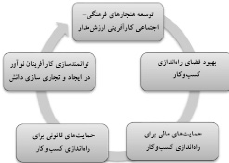
شکل ۴: مولفه‌های اصلی توسعه‌ی کارآفرینی در چارچوب گفتمان اقتصاد مقاومتی

در این پژوهش ابتدا عوامل استخراج شده از پژوهش‌های پیشین به‌عنوان موضوعات مورد بررسی برای توسعه‌ی کارآفرینی در نظر گرفته شدند. سپس با در نظر گرفتن مولفه‌های اقتصاد مقاومتی، مفاهیم و کدهای مطرح شده در پژوهش‌های پیشین در قالب مفاهیم مشابه، دسته‌بندی شدند. به این ترتیب، مفاهیم اصلی پژوهش شکل گرفت. در ادامه یافته‌های تحقیق در پنج بُعد به‌عنوان ابعاد توسعه‌ی کارآفرینی در چارچوب گفتمان اقتصاد مقاومتی معرفی می‌شوند (شکل ۴).