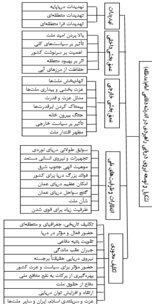
شکل (۲) شبکه مضمونی تشکیل و توسعه نیروی دریایی راهبردی در اندیشه دفاعی امام المسلمین (مدظله العالی)

محتوای CVI پژوهش ۰/۸۵ تعیین گردید؛ که نشان دهنده روایی بالا و قابل قبول می‌باشد. برای پایی نیز با استفاده از روش کنترل اعضا؛ محقق متن تدابیر و رهنمودهای فرمانده معظم کل قوا (مدظله) را چندین مرتبه مرور نموده تا بتوانند مضامین پنج‌گانه را احضا نماید. براساس فرایند صورت گرفته شبکه مضمون پژوهش به شرح زیر ترسیم گردید: