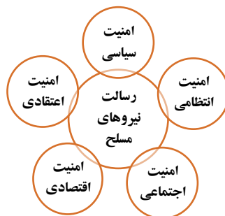
شکل (۱) رسالت نیروهای مسلح از منظر نهج‌البلاغه (نگارنده: ۱۳۹۸)

نظام‌های سیاسی نیروهای مسلح را بر مبنای رسالت‌های خاص جذب، آموزش و بکارگیری می‌نمایند در نظام اسلامی که به سعادت انسان توجه ویژه دارد این مجموعه جهت تحقق ابراهبرد یُخْرِجُهُمْ مِّنَ الظُّلُمَاتِ إِلَى النُّورِ و مقابله با ابر راهبرد یُخْرِجُونَهُمْ مِّنَ النُّورِ إِلَى الظُّلُمَاتِ نظام سلطه شکل گرفته است. رویکردهای رسالت فوق چنین ترسیم شده: «...فَالجُنُودُ بِإِذْنِ اللَّهِ: الف) امنیت اجتماعی: حُصُونُ الرَّعِيَّةِ-دژهای استوار رعیت‌اند. ب) امنیت سیاسی: وَ زَيْنُ الْأُولَاءِ-زینت والیان. ج) امنیت اعتقادی: وَ عِزَّ الدِّينِ-دین خدا به آنها عزت یابد. د) امنیت اقتصادی: وَ سُبُلُ الْأَمْنِ-راهها به آنها امن گردد. ه) امنیت فرهنگی: وَ لَيْسَ تَقْوَمُ الرَّعِيَّةُ إِلَّا بِهِمْ-و کار رعیت جز به آنها استقامت نپذیرد» (خان‌احمدی، ۱۳۹۹ الف: ۲۰۶)