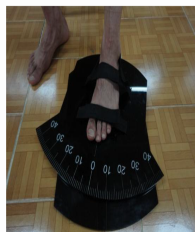
شکل ۱. نحوه نشستن و قرار گیری پا روی گونیامتر