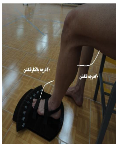
شکل ۲. نحوه اندازه گیری و هدایت به سمت زاویه هدف