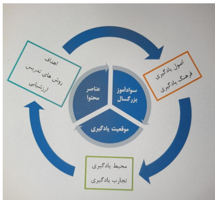
شکل (۲): مدل اولیه آموزش مجازی سوادآموزان

نیز ارزشیابی از سوادآموزان در راستای ۱ - گرفتن بازخورد (sarmadi & vella, 2007; ebrahimzadeh, 2014; ۲ - بیان دیدگاهها و ۳ - اصلاح دیدگاههای خود در عمل (Mezirrow, 1991; Quoted from esmaeili, 2014) صورت می‌گیرد. شکل ۲ مدل اولیه آموزش مجازی سوادآموزان دوره‌ی انتقال است که بر مبنای نظریه‌های آموزش مجازی و آموزش بزرگسالان ارائه شده است.