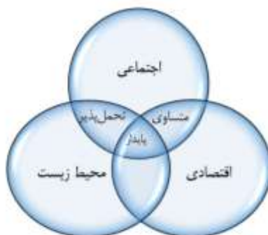
شکل ۱. مفهوم اساس سه‌گانه پایداری

«عنصر کلیدی پایداری سازمان» را شناسایی می‌کنند: جمع‌کردن جنبه‌های اقتصادی، زیست‌محیطی و اجتماعی در استراتژی سازمان، جمع‌کردن جنبه‌های کوتاه‌مدت و بلندمدت و مصرف درآمد به‌جای مصرف سرمایه. گاریس، هیومن و مارتینوزی ۱ (۲۰۱۱) پایداری را با اصول زیر تعریف می‌کنند: جهت‌گیری اقتصادی، اجتماعی و زیست‌محیطی؛ جهت‌گیری کوتاه، میان‌مدت و بلندمدت؛ جهت‌گیری محلی، منطقه‌ای و جهانی؛ جهت‌گیری ارزش. دستورالعمل ISO 26000 درباره مسئولیت اجتماعی پاسخ‌گویی، شفافیت، رفتار اخلاقی و احترام برای تمایلات ذینفعان، احترام به قوانین، احترام برای هنجارهای بین‌المللی، رفتار مناسب و احترام برای حقوق بشر را به‌عنوان «اصول» پایداری ذکر می‌کند.