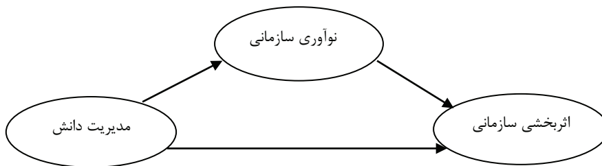
شکل ۱: مدل مفهومی تحقیق

ارتباط اثربخشی سازمانی با متغیرهای فردی، محیطی و سازمانی اثرگذار بر آن به ویژه دو متغیر مدیریت دانش و نوآوری سازمانی و ارائه یک الگوی عمومی در این حوزه، کاملاً احساس می‌شود. لذا با توجه به محدود بودن تحقیقات انجام شده در زمینه اثربخشی سازمانی به طور کلی و محدود بودن این تحقیقات بویژه در حوزه ورزش و نیز برخی نتایج متناقض در تحقیقات انجام شده و نیز عدم ارائه یک الگوی ارتباطی در زمینه متغیرهای فردی، سازمانی و محیطی اثرگذار بر اثربخشی سازمانی، هدف اصلی این تحقیق، مدل‌سازی معادلات ساختاری مدیریت دانش، نوآوری و اثربخشی سازمانی کارکنان وزارت ورزش و جوانان ایران است. با توجه به مبانی نظری و پیشینه تحقیقات انجام شده، محقق مدل زیر را به عنوان مدل زیربنایی و مفهومی تحقیق جهت مدل‌سازی این ارتباطات در کارکنان وزارت ورزش و جوانان ایران مورد استفاده قرار داد.