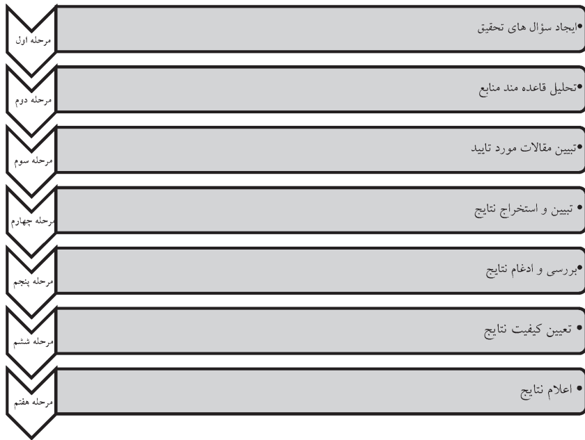
شکل ۱: مراحل پیاده سازی روش فراترکیب

بر اساس شکل ۱، مراحل مبسوط پیاده سازی روش فراترکیب به شرح زیر می باشد: