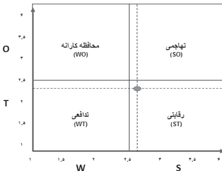
شکل ۲: ماتریس عوامل داخلی و خارجی (IE) و تعیین نوع راهبرد

براساس یافته های پژوهش و با توجه به نتایج SWOT و همچنین نمره نهایی ماتریس ارزیابی عوامل داخلی (۲/۵۹) و ماتریس ارزیابی عوامل خارجی (۲/۲۹) و مقایسه آنها مشخص گردید که جایگاه پایگاه های ورزش قهرمانی کشور در موقعیت راهبرد ST قرار دارد و باید از راهبرد تنوع و رقابتی در مورد آنها استفاده نمایند (شکل ۲). بنابراین در تدوین راهبردهای لازم در موقعیت مذکور حذف نقاط ضعف و بهبود آنها، افزایش نقاط قوت، مقابله با تهدیدهای جدی، ارتقای کمیت و کیفیت ها و شناخت آسیب های سازمان و رفع آنها جهت توسعه پایگاه های ورزش قهرمانی کشور حائز اهمیت می باشد.