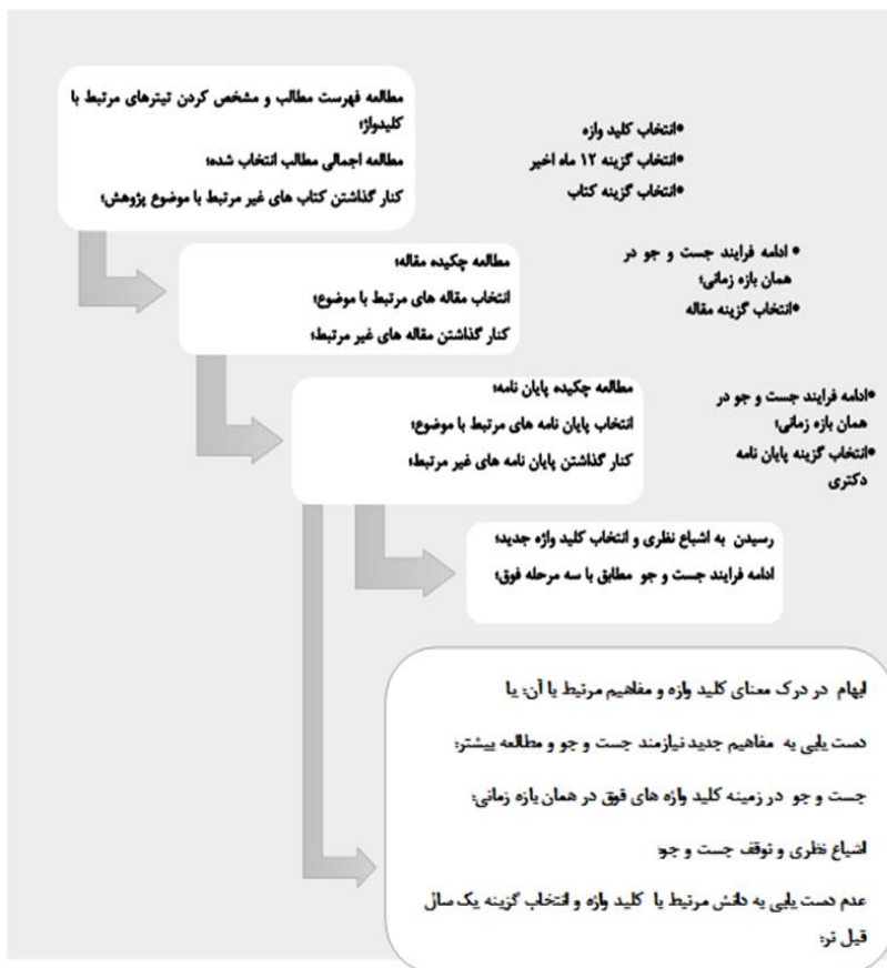
شکل ۱: فرایند جست و جوی منابع مرتبط با کلید واژه ها

تی پک، برنامه درسی آموزش عالی و پداگوژی، پداگوژی آموزش عالی، مدل های پداگوژی، و انواع پداگوژی مورد جست و جو قرار گرفتند. در فرایند جست و جو مراحل متوالی مطابق شکل ۱ طی شده است.