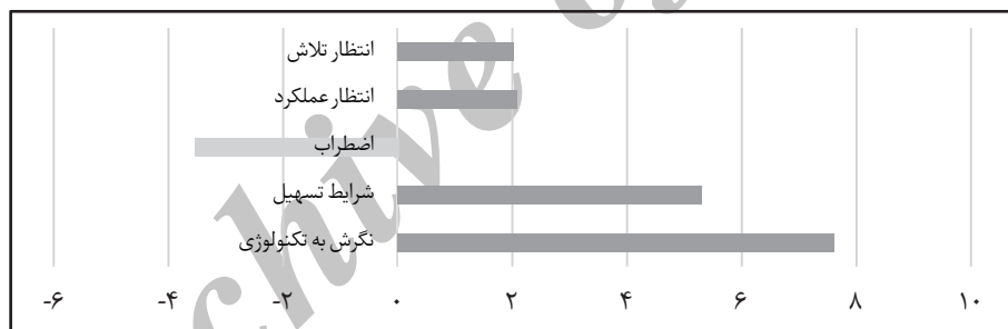
شکل ۲. رتبه‌بندی عوامل تأثیرگذار. منبع: یافته‌های پژوهش

با توجه به نمودار ۱، عامل نگرش به پذیرش کیف پول الکترونیک بیشترین اثر مثبت را بر قصد استفاده از این خدمت پرداخت الکترونیک دارد و بعد از آن شرایط تسهیل بیشترین تأثیر را داد. اما میزان اضطراب و ترس از استفاده از کیف پول الکترونیک اثر منفی و تقریباً متوسط و رو به بالایی بر پذیرش کیف پول الکترونیک از سوی مصرف‌کنندگان دارد.