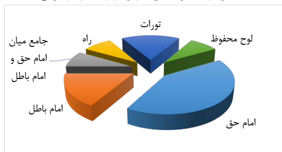
نمودار ۱: نمونه‌های کاربرد واژه امام در قرآن

تمایز پژوهش حاضر تمرکز بر آیه ۱۲ سوره مبارکه یس و دستیابی به مفهوم «امام» در این آیه است. در آیه ۱۲ سوره مبارکه یس (إِنَّا نَحْنُ نُحْيِي الْمَوْتَىٰ وَنَكْتُبُ مَا قَدَّمُوا وَآثَارَهُمْ وَكُلَّ شَيْءٍ أَحْصَيْنَاهُ فِي إِمَامٍ مُّبِينٍ) سخن از دو کتاب است: کتابی که اعمال انسان قبل از مرگ و همچنین باقیاتی که بعد از مرگ از خویش به جای می‌گذارد، در آن ثبت است (نَكْتُبُ مَا قَدَّمُوا وَآثَارَهُمْ) و به نوعی کتاب اعمال (أَمْتٍ يَا فَرْدِي) محسوب می‌شود و کتابی که برای عموم موجودات است و «كُلَّ شَيْءٍ» در آن ثبت شده و از آن تعبیر به «امام» شده است. بنا به نظر مفسران منظور از «إِمَامٍ مُّبِينٍ» لوح محفوظ است (طباطبایی، ۱۴۱۷، ج ۱۷، ص ۶۷؛ بیضاوی، ۱۴۱۸، ج ۴، ص ۲۶۴؛ طوسی، بی‌تا، ج ۸، ص ۴۴۷؛ طبرسی، ۱۳۷۲، ج ۸، ص ۶۵۴)؛ لوحی که از دگرگون‌شدن و تغییر پیدا کردن محفوظ است و مشتمل بر تمام جزئیاتی است که خداوند سبحان برای خلق اراده کرده است.