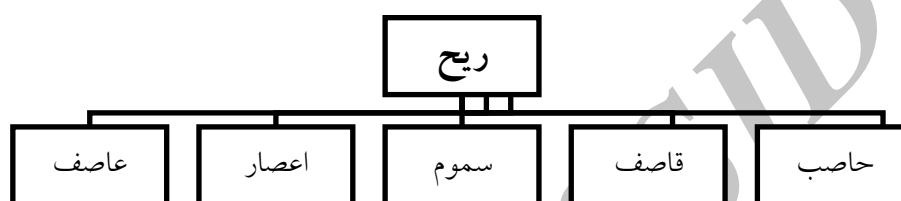
نمودار ۳: حوزه معنایی ریح در رابطه شمول معنایی

عذاب برای کافران است. بنابر شمول معنایی، واژه «ریح» یک واژه اصلی معنی واژه‌های «حاصِب، قَاصِف، سَموم، اِعصَار، عَاصِف» را در بردارد و با آمدن هریک از این واژه‌ها، کلمه ریح در ذهن مجسم می‌شود و رابطه نوعیت بین آنها برقرار است؛ بنابراین گفته می‌شود حاصِب نوعی باد است با ویژگی‌های خاص خودش و درباره بقیه کلمات زیرشمول «ریح» نیز این رابطه وجود دارد.