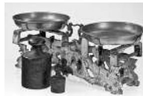
تصویر ۲: ترازو

در دنیایی که ما زندگی می‌کنیم در خرید کالاهایی چون خرما، حبوبات، سبزیجات و... از ترازو و وزنه برای اندازه‌گیری ارزش آنها استفاده می‌کنیم.