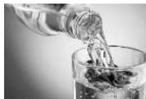
تصویر ۱: ظرف و مظروف

این مطلب که گفته شد در آخرت ظرف تابع مظروف است، بدین نکته اشاره دارد که ظرف و مظروف در جهان آخرت غیر مادی و متغیر هستند، برعکس ظرف و مظروف دنیایی که کاملاً محدود و ثابتند.