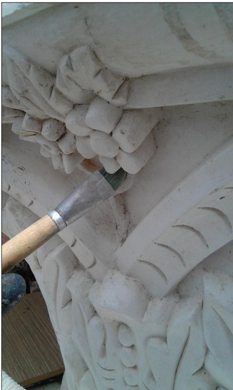
شکل ۲: انجام مراحل مرمت و بازسازی نمونه اصلی سرستون گچی انتخاب‌شده