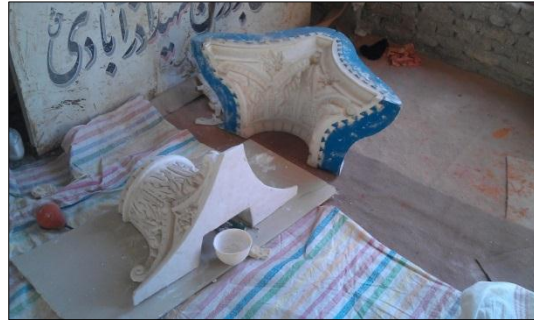
شکل ۳: نمونه‌سازی قطعات جدید با استفاده از قالب دوپوسته Fig. 3: Prototyping of new parts using Hard-Shell Mold

پس از ساخت و تکمیل بخش‌های مختلف قالب، سرستون‌های جدید از طریق قالب‌گیری گچ نمونه‌سازی گردید (شکل ۳) و در موقعیت‌های تعیین شده بر روی ستون‌ها نصب گردید (شکل ۴). نمونه‌های ساخته شده از روی قالب نمونه اصلی به دلیل به کارگیری گچ به صورت زنده و سریع در فرآیند قالب‌گیری دارای بافت یکپارچه و