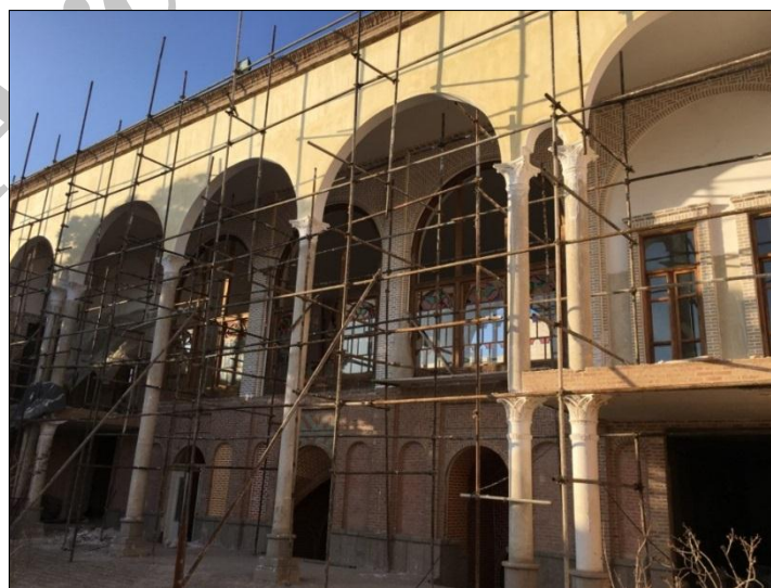
شکل ۴: نصب نمونه‌های قالب‌گیری شده در موقعیت‌های موردنظر Fig. 3: Assembling molded samples in the intend positions

پس از ساخت و تکمیل بخش‌های مختلف قالب، سرستون‌های جدید از طریق قالب‌گیری گچ نمونه‌سازی گردید (شکل ۳) و در موقعیت‌های تعیین شده بر روی ستون‌ها نصب گردید (شکل ۴). نمونه‌های ساخته شده از روی قالب نمونه اصلی به دلیل به کارگیری گچ به صورت زنده و سریع در فرآیند قالب‌گیری دارای بافت یکپارچه و