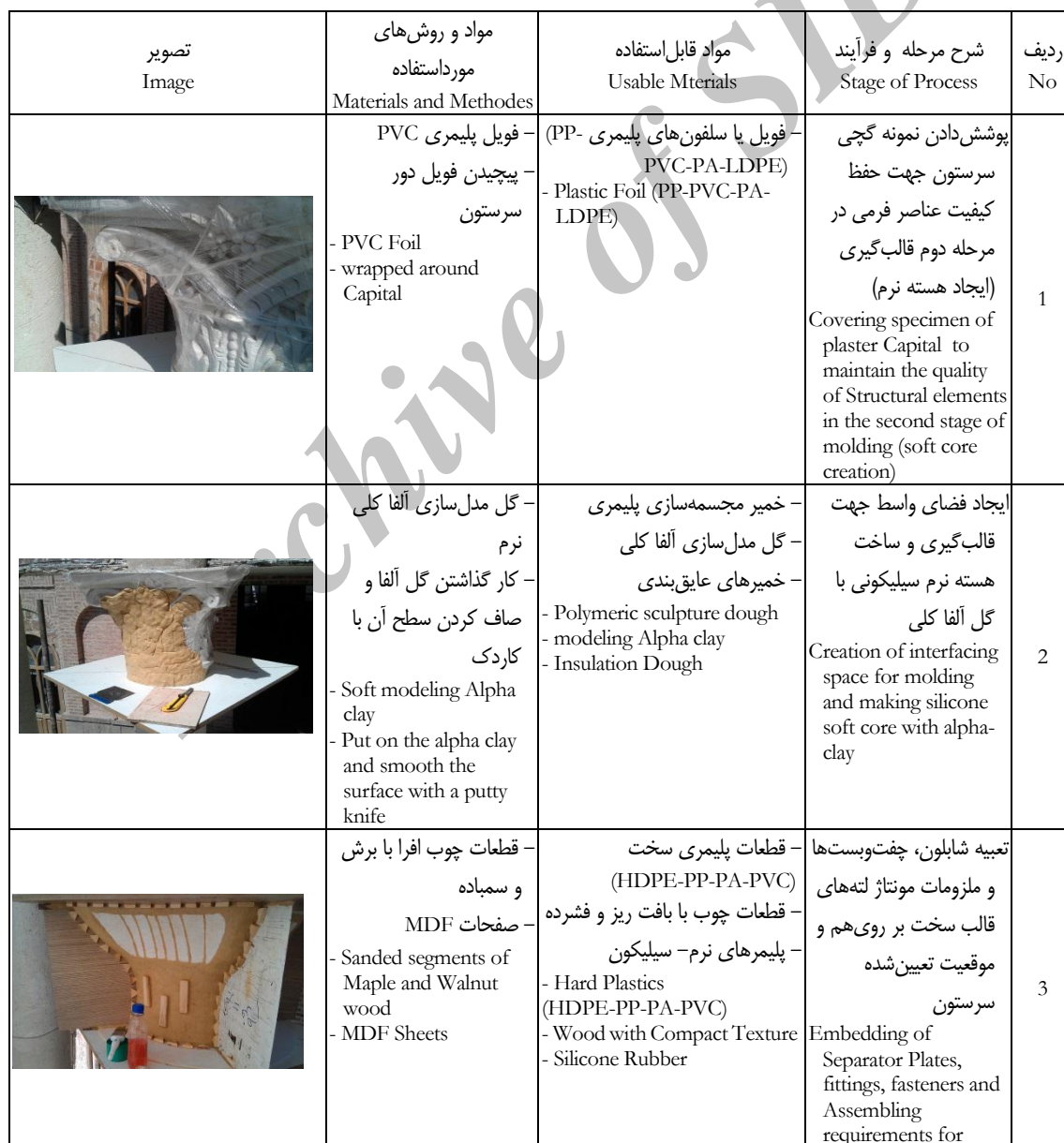
Table 1: Stages of the process of making the Hard-Shell Mold on the selected original Plaster Capital