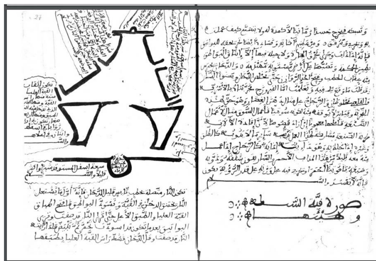
شکل ۲: طرحی از کوره چوب سوز در کتاب الدرّه المکنونه ، کتابخانه ملی فرانسه Fig. 2: Design of wood-burning kiln in al Durra al-Meknuna, National Library of France