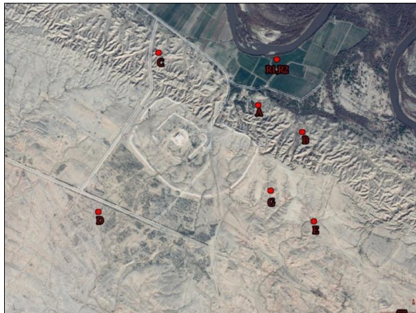
نقشه ۱: نقشه پراکنندگی معادن بررسی شده، بر روی عکس ماهواره‌ای از منطقه چغازنبیل

و از آبرفت های جوان این ناحیه که در شمال شرقی