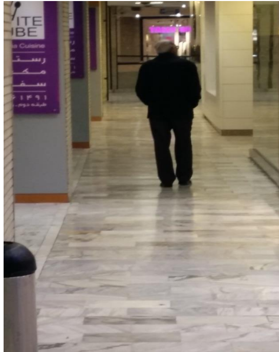
منبع: نگارندگان، دی ۱۳۹۴