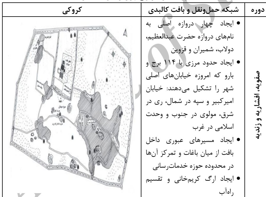
جدول ۴: سیر دگرگونی تهران از صفویه تا قاجاریه

محمدیه تا چهارراه مولوی)، از شرق به خیابان مصطفی خمینی و از غرب به خیابان خیام محدود می‌شود. این بافت به جهت محدوده هسته تاریخی دوران صفوی را تشکیل می‌دهد که البته قدمت بسیاری از بناها و معابر آن به پیش از این می‌رسد. بررسی‌ها نشان می‌دهد قدمت ۲۷ درصد از این محدوده (داخل باروی اول) بیش از ۴۰۰ سال است و ۴۳ درصد از محدوده لبه خیابان‌های شهری همچنان جزو بدنه ارزشمند تاریخی محسوب می‌شود (باوند، ۱۳۸۳: ۲۲-۱۹). همین موضوع اهمیت هرچه بیشتر نحوه و میزان مداخله در این بافت ارزشمند را پیش از هر نوع تصمیم‌سازی مشخص می‌سازد؛ چرا که باید پذیرفت تغییراتی که به‌واسطه ساختار معابر در شهرها صورت می‌گیرد به ندرت و در برخی موارد هرگز قابل جبران نیستند. پیش از بررسی چگونگی این تأثیرات لازم است تا سیر دگرگونی این بخش از تهران را به‌صورت اجمالی موردبررسی قرار دهیم.