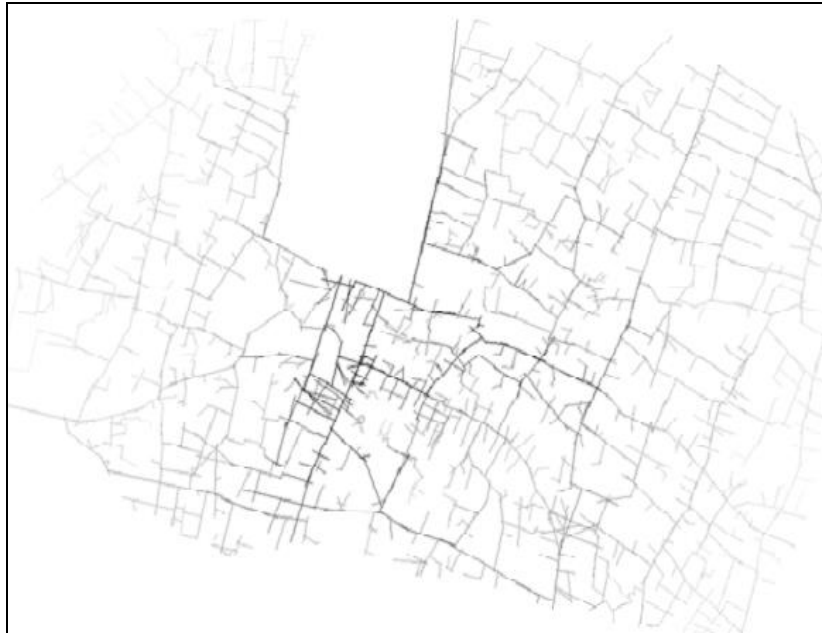
تصویر ۳: نقشه هم‌پیوندی بافت تاریخی تهران

با توجه به مباحث و مبانی نظری مطرح شده بررسی رابطه شبکه حمل‌ونقل شهری و بافت کالبدی تاریخی در شهر تهران در چهار دسته متغیر قابل بررسی است که جداگانه به آنها پرداخته خواهد شد.