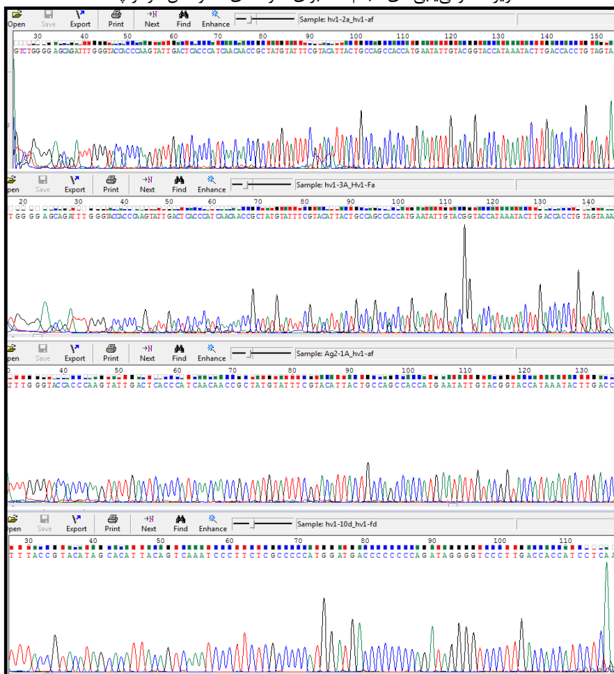
تصویر ۱: توالی‌یابی‌های انجام‌شده برای نمونه‌های عصر آهن گوهرتپه

نظر به عدم توالی‌یابی کامل برای نمونه‌های منتسب به عصر مفرغ، تنها نمونه‌های عصر آهن محوطه مورد استناد قرار گرفتند.