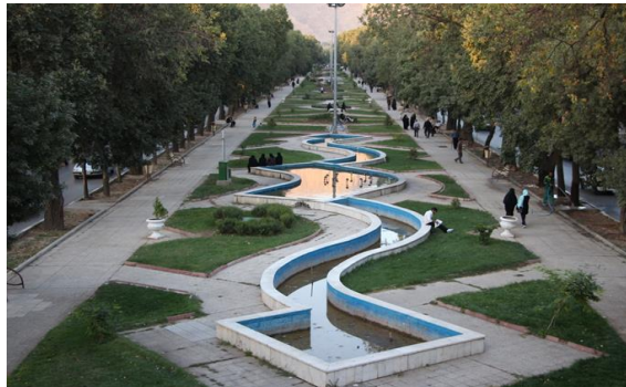
تصویر ۳: پویایی و سرزندگی در بلوار تاقبستان

عکس، محسن خداده، انجمن عکاسان کرمانشاه، مهر ۱۳۹۶. مونوریل در سرتاسر ضلع غربی این بلوار امتداد یافته است.