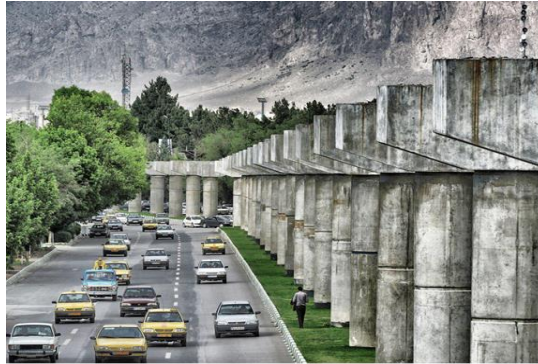
مهر ۱۳۹۶