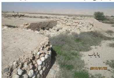
شکل ۶. (چپ) غُلگه‌ای با عظمت که گوش‌های بلند و طولی دارد (۲/۱۱/۱۳۹۶، دشت گزیر).