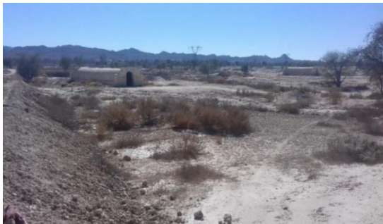
شکل ۴. شل‌گیری در بالادست آب‌انبارها (۱۱/۱/۱۳۹۶، دشت گزیر)